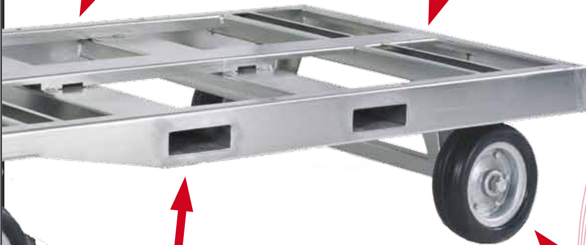
FERITOIE DI INFORCAMENTO