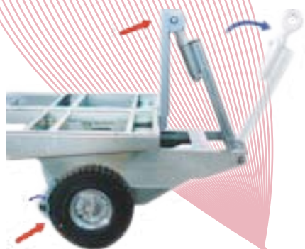
TIMONE CON AUTOFRENO