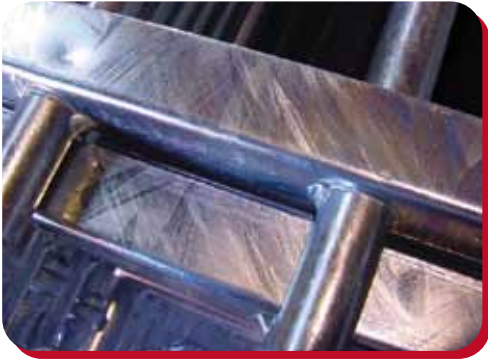
TELAIO IN ACCIAIO ZINCATO